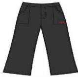
GREY TROUSERS GIRLS