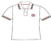
SHORT SLEEVE POLO T-SHIRT