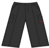
GREY CARGO TRS. BOYS