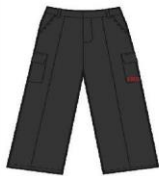
GREY CARGO TRS. BOYS