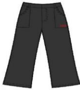
GREY TROUSERS GIRLS